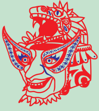
Actos festivos y lúdicos