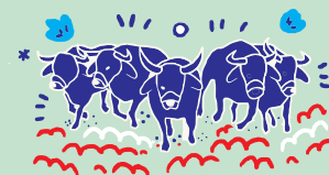
PCI asociado a los eventos de la vida cotidiana