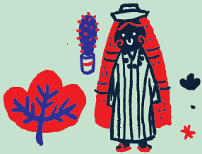
Sistemas normativos y formas de organización social tradicionales