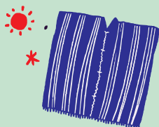
Técnicas y tradiciones asociadas a la fabricación de objetos artesanales