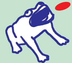
Juegos y deportes tradicionales

Las melodías de las diversas músicas, las cosmogonías y tradiciones orales, la ceremonialidad y ritualidad que envuelve las semanas santas, los carnavales y festividades que celebran la vida y la creatividad, los bailes y comparsas, la cocina de familia llena de tradiciones y sabores, la sabiduría del artesano que pone al servicio de su arte técnicas ancestrales, los sistemas médicos tradicionales y todos los conocimientos, expresiones, usos, valores, saberes y técnicas que son expresados a través de prácticas culturales, constituye el patrimonio cultural inmaterial o PCI.