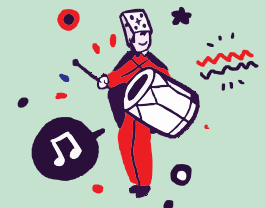
Eventos religiosos tradicionales de carácter colectivo