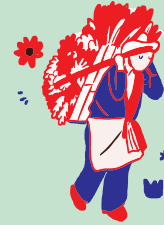
PCI asociado a los espacios culturales