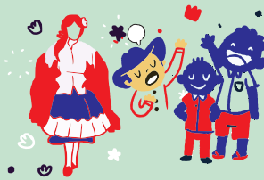
Lenguas lenguajes y tradición oral